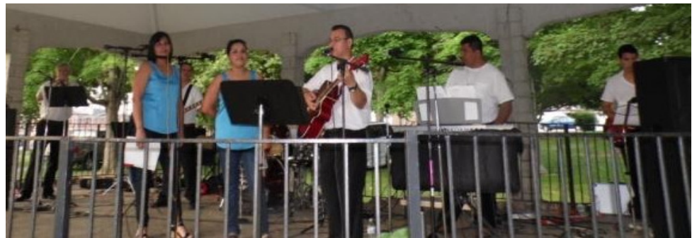
In the Carthage Park