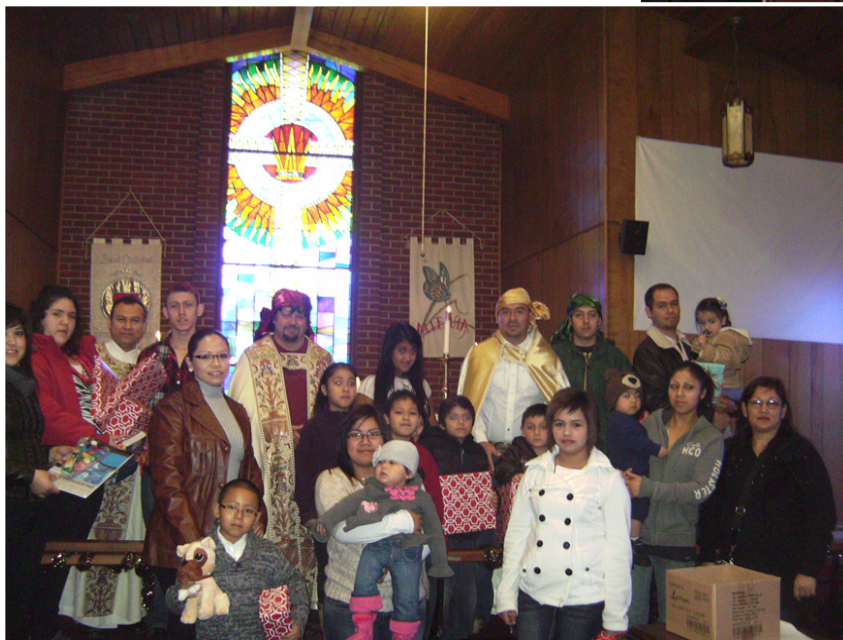
January 6 Feast of the Three Kings at St. Nicholas, Noel