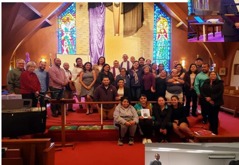
Lenten Spiritual Retreat at Church of the Good Shepherd Kansas City