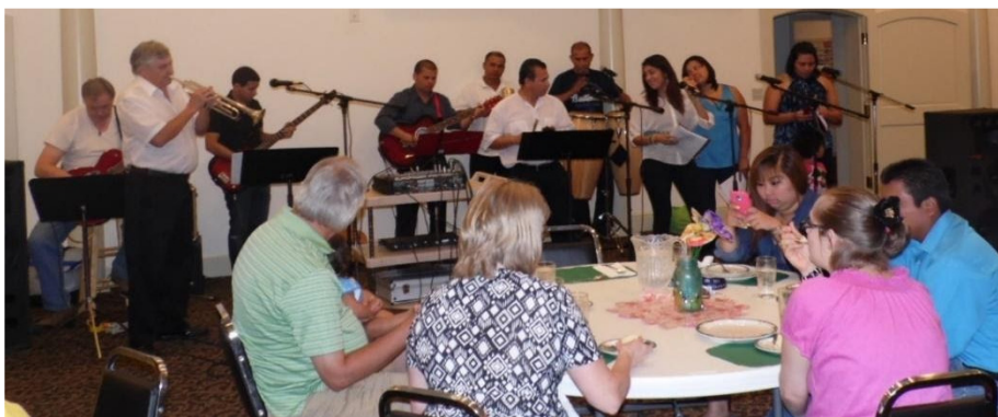
Encore Lunch at Grace Church, Carthage