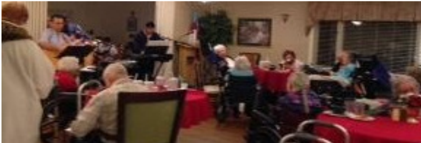
Cinco de Mayo in St. Luke's Nursing Center Carthage every year

Guitarras, piano eléctrico, batería, canto, ¿es buena la música que toca la banda hispana? La banda toca en eventos comunitarios y religiosos en Noel y Cartago.