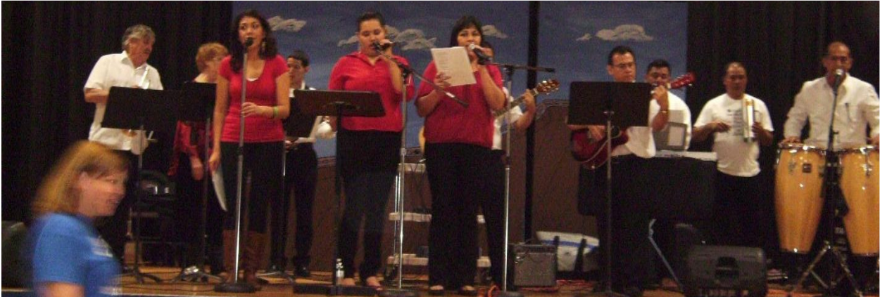
Celebrating Cultures, music and food at Carthage School.